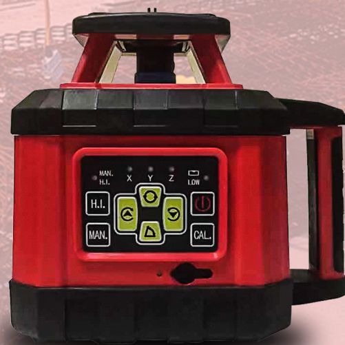
TRL 131/TRL 134