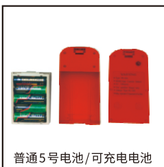
普通5号电池/可充电电池