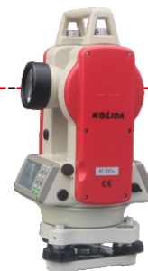
激光线与视准轴同轴